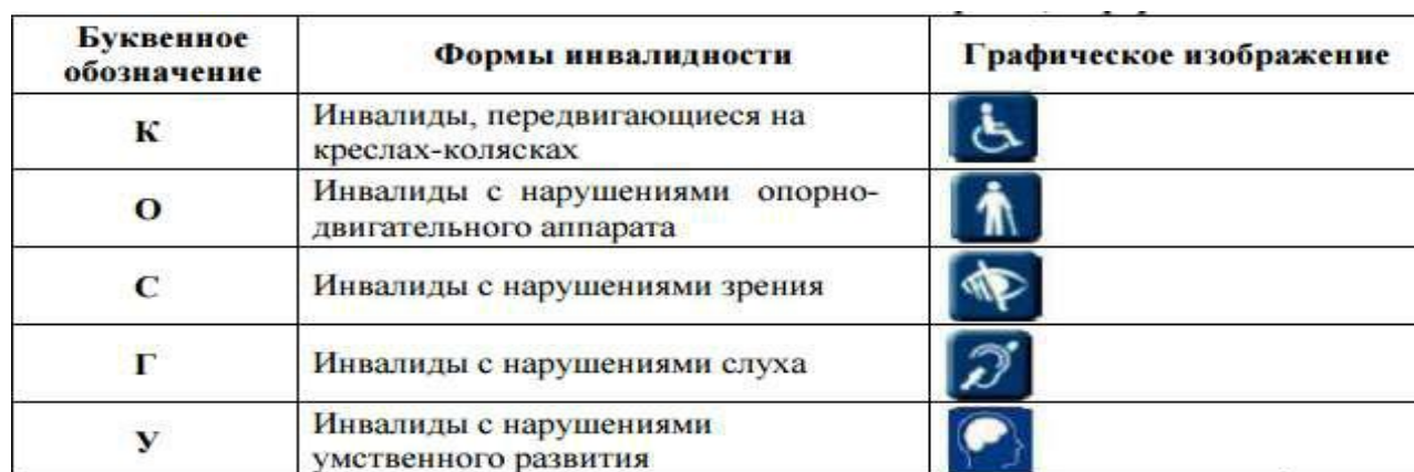
Таблица 2 Классификация форм инвалидности

Для решения вопросов создания доступной среды жизнедеятельности на объектах социальной инфраструктуры разработана классификация форм инвалидности, которую условно можно обозначить «пентадакогсу» (табл.2).