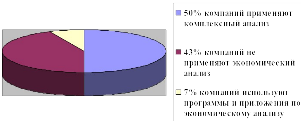
Рисунок 1 - Практика применения экономического анализа по результатам исследования ведущих российских компаний